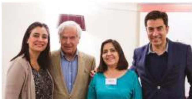
LOS PADRES Y MADRES COMPARTIERON CON LOS INTEGRANTES DEL DIRECTORIO DE LA FUNDACIÓN.

CIUDADES DE PROCEDENCIA DE LOS ASISTENTES