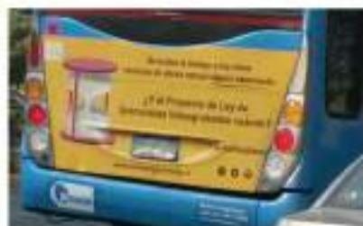
Microbuses de Alsacia & Express recorrieron Santiago.