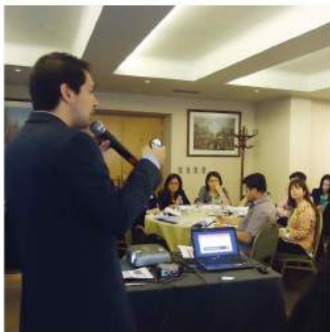
ENTRE LOS TALLERES EFECTUADOS DESTACÓ EL IMPARTIDO A FISCALES, ASISTENTES DE FISCALES Y PSICÓLOGOS DE LA FISCALÍA REGIONAL METROPOLITANA OCCIDENTE.

Cabe señalar que los talleres constituyen también una valiosa instancia de conocimiento para los profesionales de la Fundación, pues les permiten escuchar las opiniones y experiencias de los operadores mismos del Sistema Penal.